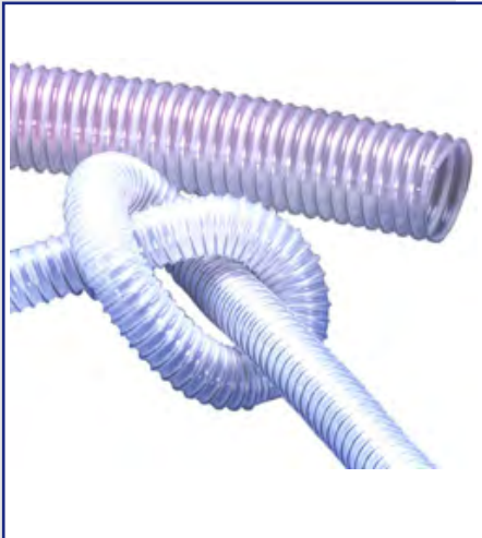
PUR Saugschlauch Art.-Nr.: 709230000010