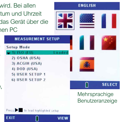
Wahl der Konfiguration

Auf dem Gerät können bis zu 100 Messungen gespeichert werden, ohne dass ein Download erforderlich wird. Bei allen Messläufen werden Datum und Uhrzeit mitgespeichert. Wenn das Gerät über die USB-Verbindung an einen PC angeschlossen wird, verhält es sich wie eine Speicherkarte, so dass Sie Dateien auf einen PC übertragen und jederzeit neu ansehen können ohne dass eine bestimmte Software erforderlich ist.