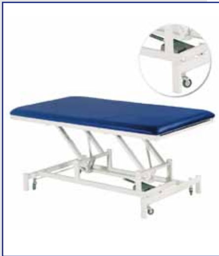
Therapieliege - C 421 Art.-Nr.: 7668C4210000