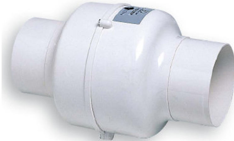
Radiallüfter aus kunststoff