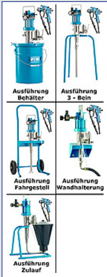
Air-Combi Lackiergerät Artikel-Nr.: 1013810014