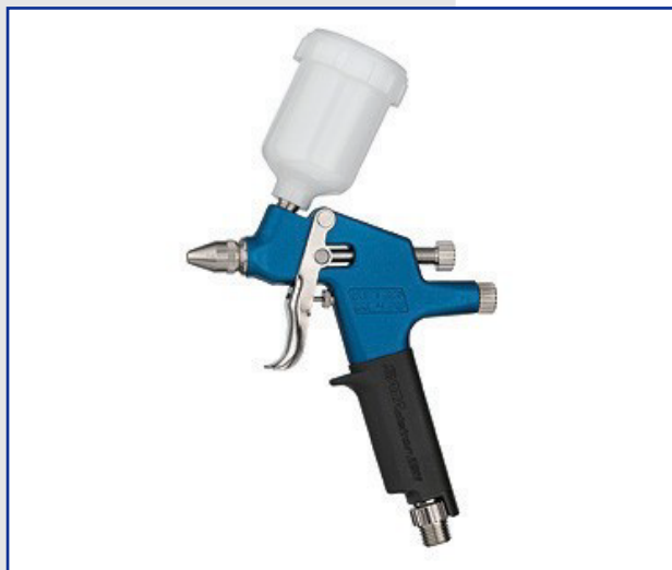
SATA Dekor 2000 Artbrush Art.-Nr.61650x