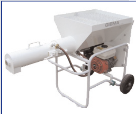
G20 Durchlaufmischer Art. Nr.: 35811320-3