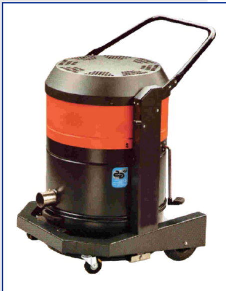
Industriesauger „KE 2318“ Artikel-Nr.: 55232318