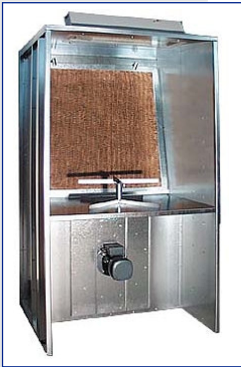
Farbspritzstand Typ 700 Art.-Nr. 553131002001