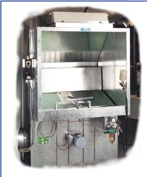
Farbspritzstand Typ 77 Art.-Nr. 553131002004