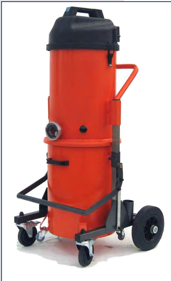
Elan 20 Art.-Nr. 55212002