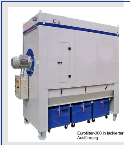
Eurofilter-300 in lackierter Ausführung