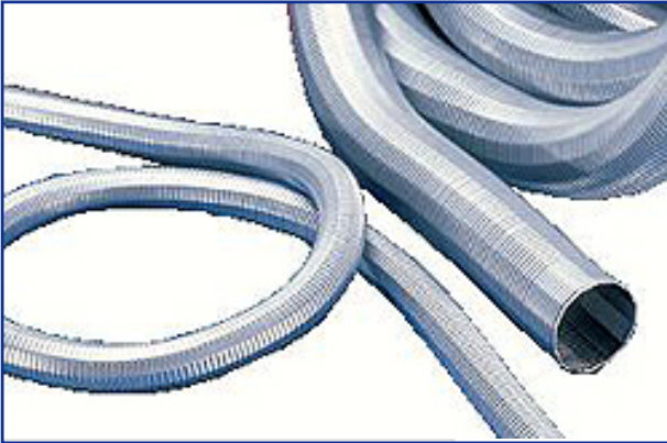
Metallschlauch Glasfaden Art.-Nr.: 702537500000