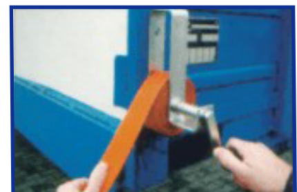
retract crank extract strap-roll

* add VAT and shipping expenses. Mistakes, price adjustments and intermediate sales reserved.