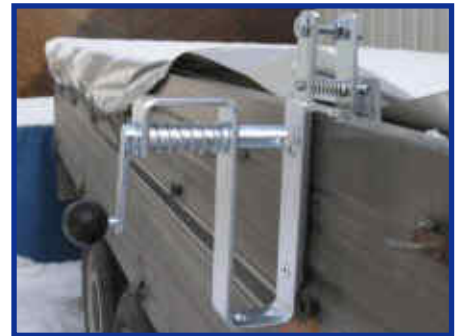
Clamps by clamps on platform gates with wall thickness till 35 mm