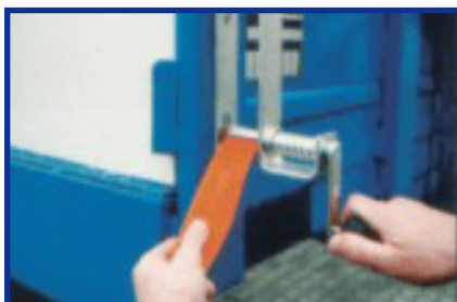
insert strap in slot