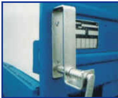
Screws by 2 screws on loading area or platform gate