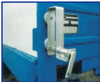
Magnets by magnets on metal surface