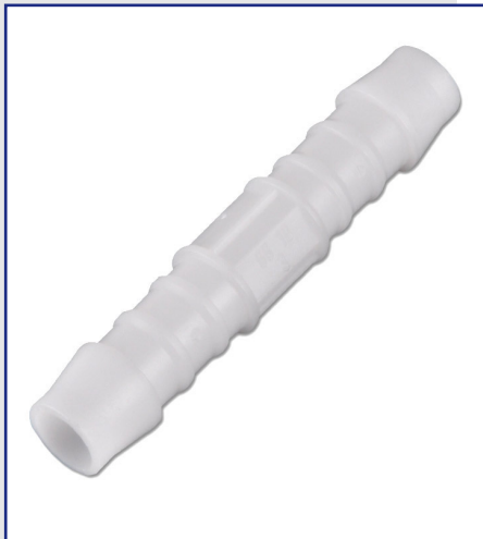
Gerade Schlauchverbinder Art.-Nr.: 977220000000